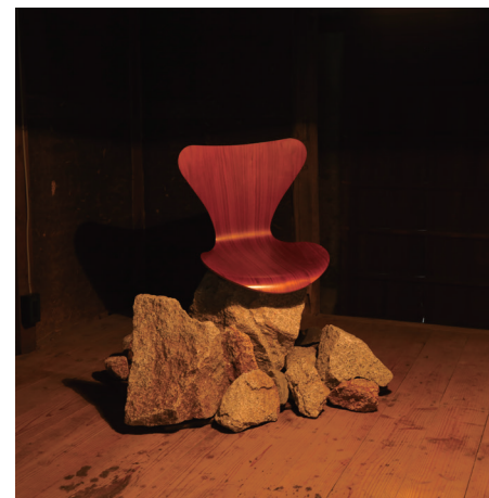
石の島と言われている本島の石を使ったインスタレーション。