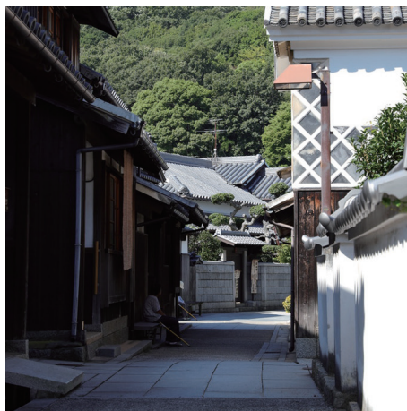
国の重要伝統的建造物群保存地区に選定されている笠島集落。

潮が湧きたつような「フリッツ・ハンセン島」のロゴマークは塩飽勤番所跡の瓦をモチーフにデザインされたもの。 岡山県と香川県に挟まれた瀬戸内海に浮かぶ28の島々は塩飽諸島と呼ばれ、笠島集落は「笠島まち並保存地区」であり、かつて名を馳せた塩飽大工の技を見ることが出来ます。 しかし過疎化と高齢化が進み空き家も増えつつある今、本島と同じ香川県丸亀市にあるインテリアショップ「CONNECT(コネクト)」が、北欧インテリアのチカラで古民家を再生させるプロジェクトを実現させました。 プロジェクトに力を貸してくれたのは、FRITZ HANSEN(フリッツ・ハンセン)。 北欧を代表する老舗家具ブランドとして周知されるフリッツ・ハンセンと本島の古民家はクラフトマンシップ【職人の技の巧み】において似ているのです。 また百年以上を経て古さを感じさせないのも北欧インテリアと本島の