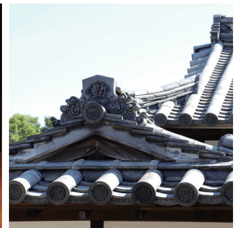
「フリッツ・ハンセン島」のロゴマークになった、塩飽勤番所跡の瓦。