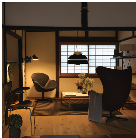
空間と家具に合わせた照明も全てフリッツ・ハンセンのアイテム。